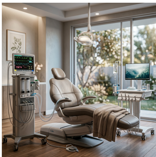
Svjesna sedacija — potpuno opušteni tijekom zahvata bez straha i boli

Strah od stomatologa je potpuno normalan — i mi to razumijemo. Zato nudimo svjesnu sedaciju: naprednu metodu koja vas drži potpuno opuštenim i bez boli tijekom cijelog zahvata, a istovremeno ste budni i možete komunicirati.