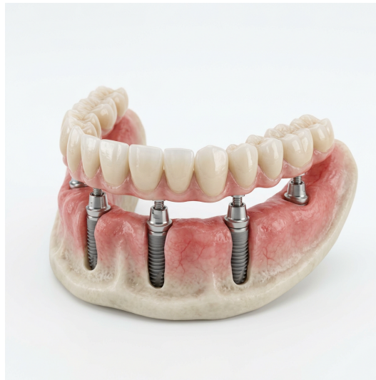
All-on-4 koncept — novi zubi u samo jednom danu

Zamislite da ujutro uđete u ordinaciju bez zuba, a poslijepodne izađete s potpuno novim, fiksnim osmijehom. To nije fikcija — to je All-on-4 i All-on-6 protokol, revolucionarna metoda koja je promijenila život tisućama pacijenata diljem svijeta.