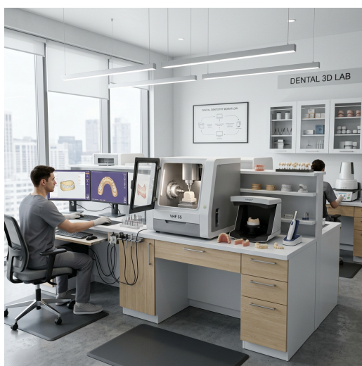
Vlastiti digitalni laboratorij za izradu preciznih protetskih radova

Smile Implant centar posjeduje vlastiti digitalni laboratorij s najmodernijom CAD/CAM opremom. To znači: potpuna kontrola kvalitete, brža izrada i savršen spoj između implantata i krunice — sve pod jednim krovom.